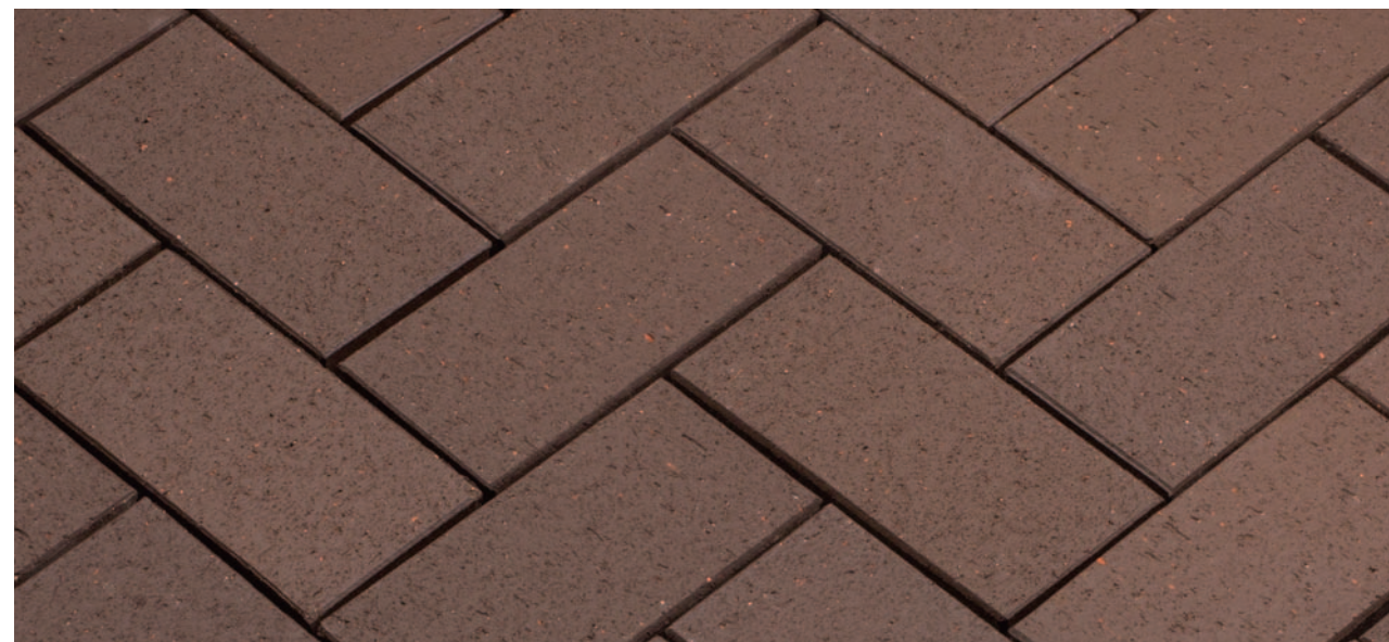
Baltic Braun – Коричневый