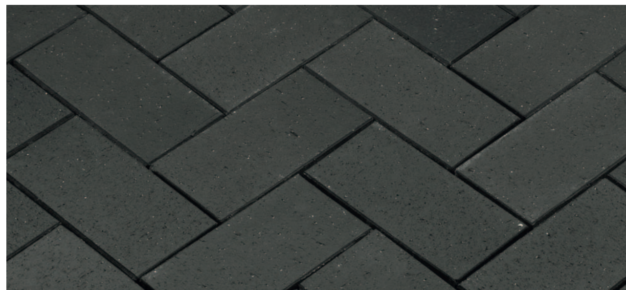
Baltic Grafit – Черный