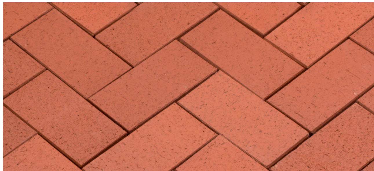
Baltic Classic – Красный