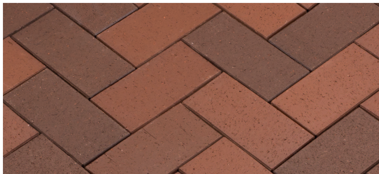
Baltic Nuance – Терракотовый